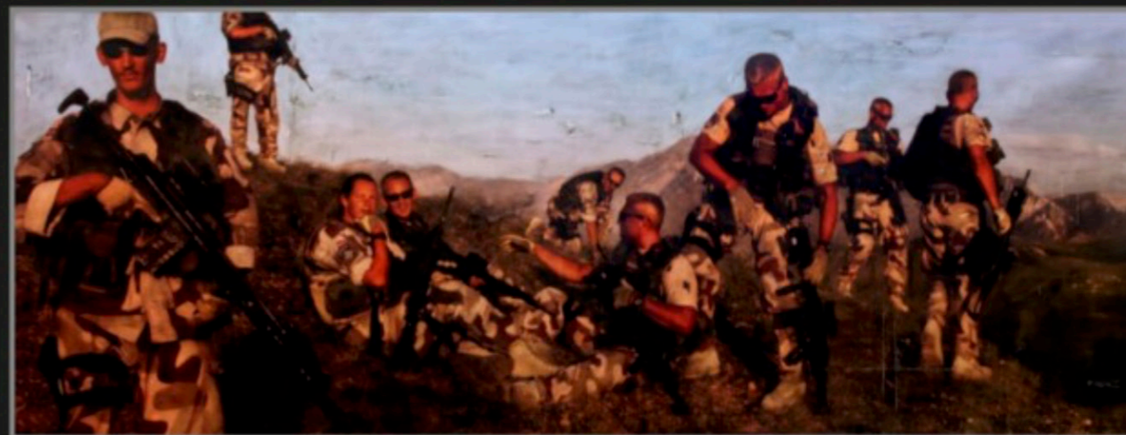
Per Fronth lagde dette bildet som en del av Afghanistan-serien «Theatre of War». Bildet, som viser norske soldater i feltet, er nesten 4,5 meter langt. Det ble kjøpt av Etterretningstjenesten.