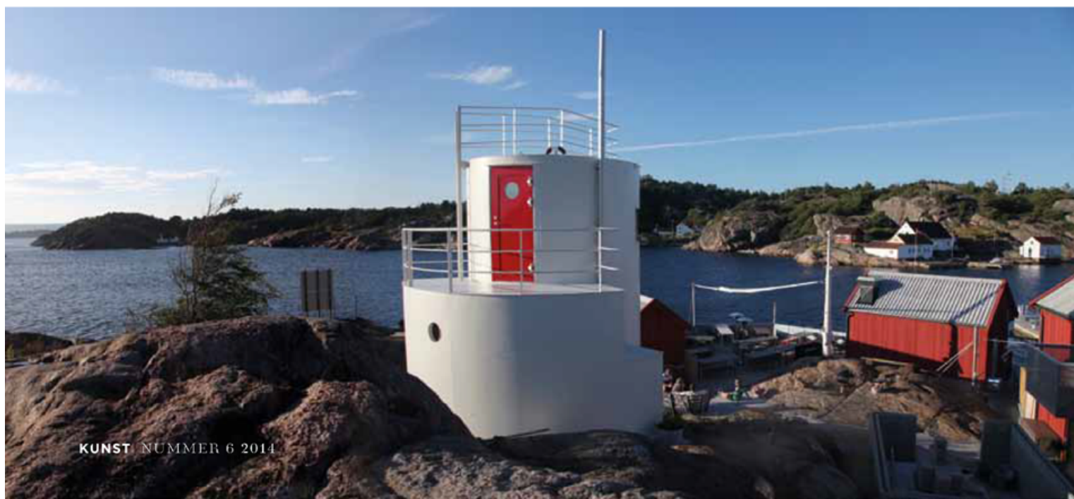
KUNST. NUMMER 6 2014