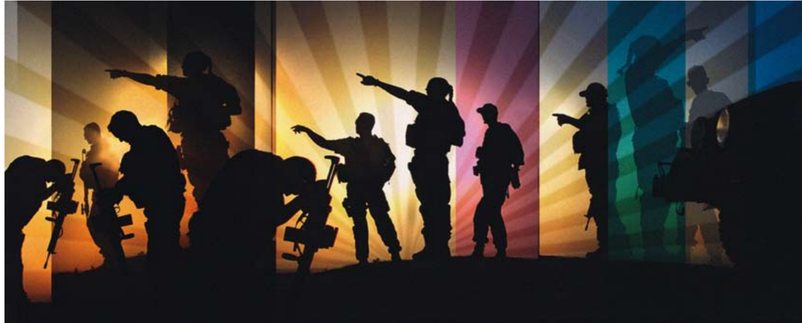
Study for Two Sunsets / Theatre of War /AFG Phototransfer/Oil on Wood 100 x 40 cm