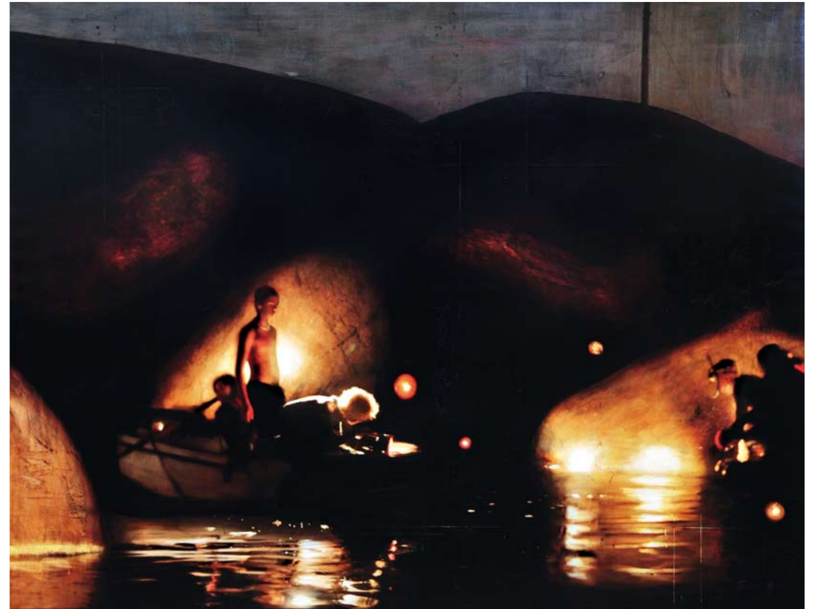
Bridge (Teenage Lux) Ver IV. Mixed Media/Oil on Canvas 200 x 160 cm