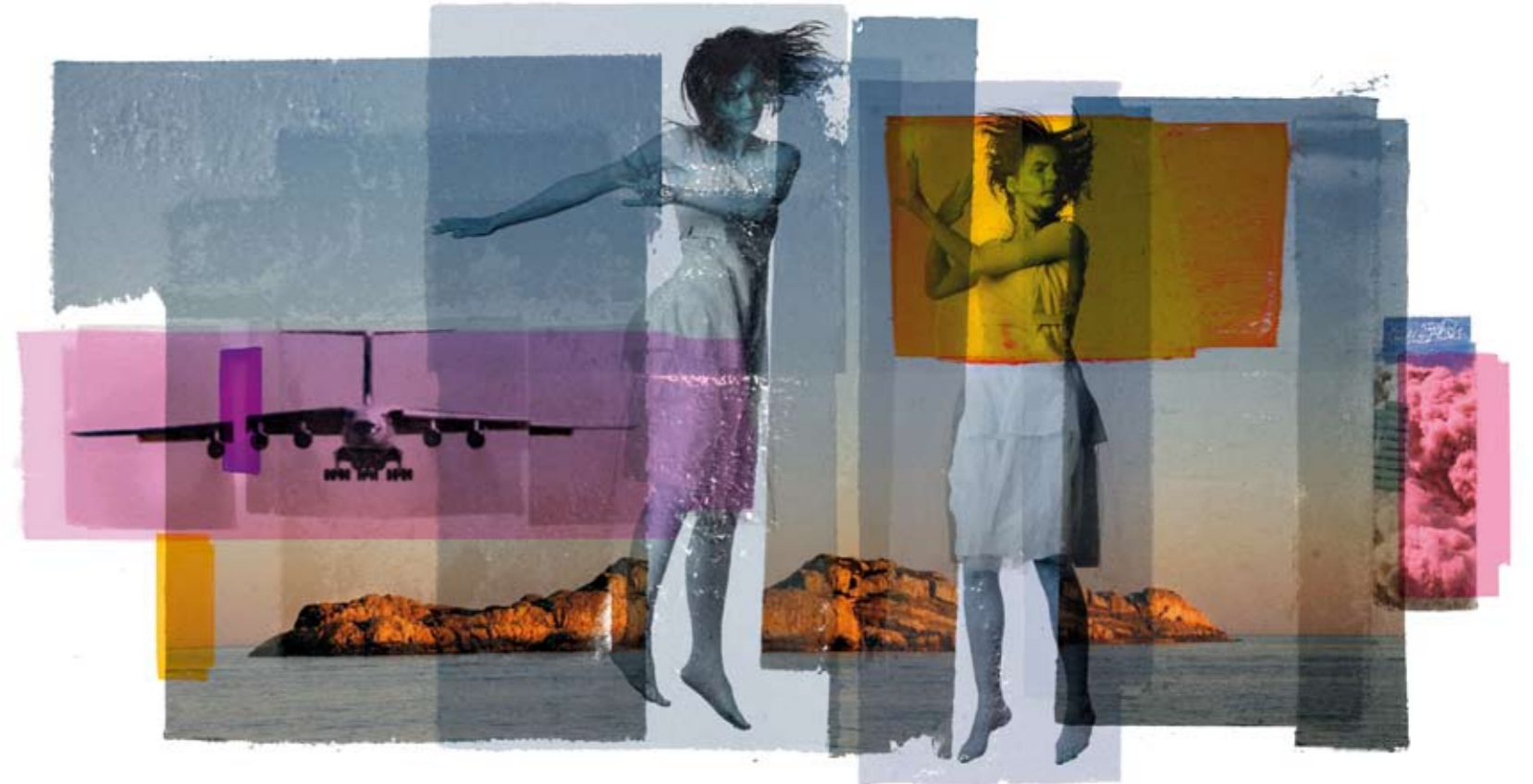
Defence / Afternoon (Antonov/AFG) Original Digitalt Arbeid/UV Arizona 210 x 110 cm